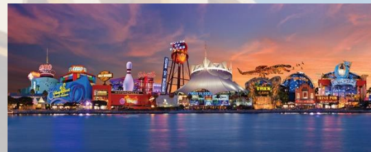
Disney World, Florida